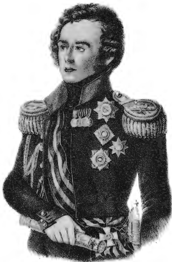
Генералъ Фельдмаршалъ Графъ Масловскій-Дривинскій.